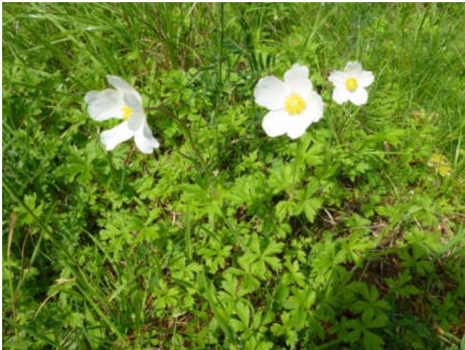
Großes Windröschen (Hochrhön, Mai 2018)

Die Jubilare werden rechtzeitig und persönlich zur Jubiläumsfeier eingeladen.